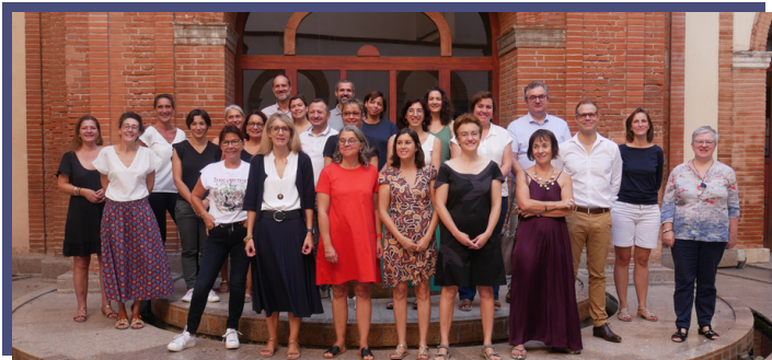
Photo promotion EIM 2023-2024

“ Le parcours EIM est très riche. Il apporte de vrais atouts utiles dans le quotidien professionnel et permet aussi un véritable enrichissement personnel .